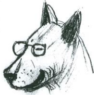
M. WÄ - 55