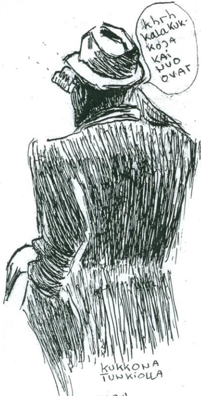
TULEN JOHTAJA (KUN TEIMME RETKEN JÄRJEN RAHOIN)