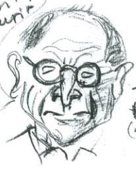
Träträt #rät (mauna)

no... asit. laiskurit kai myt jotain oraitte