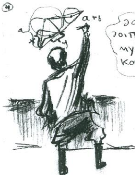
LUOKKA RATKAISEE YHDESSÄ TIENTÄVÄN NIINKUIN NÄKYY

kansantaloustundin huvi kestää vähän aikaa, mutta se onkin sentään huvi (TUNNIN alussa) (wickeyn poseeraus)